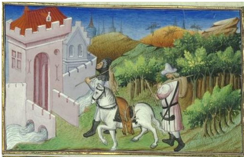
図1 シンジュマトゥ市と城外を流れる運河、周囲の山野と獲物を馬に帰還する狩人