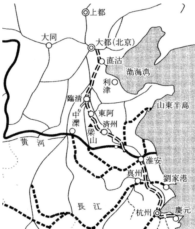
図2 元代交通図 (松田孝一)

これら運河建設についての歴史的経緯と、マルコ・ポーロの記述の事実との対応については、最後に改めて求氏による解説に見る。