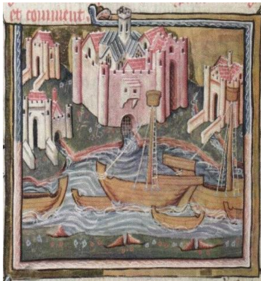
図1 コイガンジュ淮安州とカラモラン黄河 Oxford, Bodley 264, f.253v

(転記はVAの他は全て Univ. di Venezia, Ramusio Project より、F・Z・Rの和訳は拙訳『世界の記』名古屋大学出版会 2013 より、章末の解説は主に拙著『マルコ・ポーロとルスティケッロ』近代文藝社 2016 より、いずれも一部変更あり。太字は、転記・和訳ともFはZ・Rとの、他はFとの異なり。写本コピーは、各版ともまとめて冒頭に置く。)