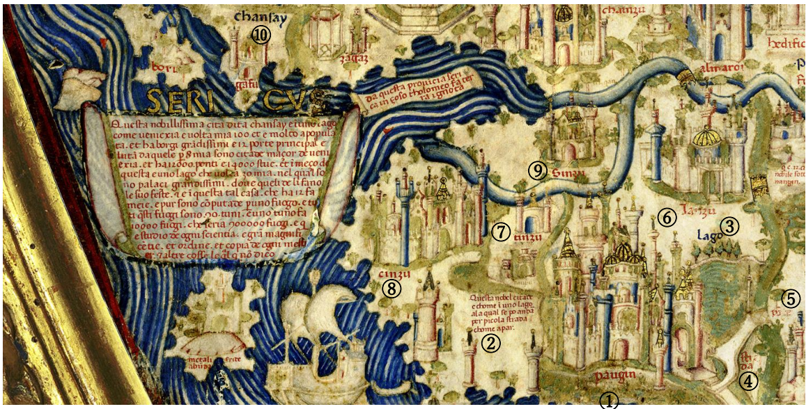
図3 Fra Mauro (上南下北)

①Paugin パウキン宝応 ②Questo nobel citade e come in un lago, a la qual se po andar per picola strada chome apar. 「この立派な市①は湖③の中にあるごとくで、そこへはここに見えるような小道④⑤を歩いて行くことができる」 ③Lago 湖 ④strada 道 ⑤ponte 橋 ⑥Janzu ヤンジュ揚州 ⑦tinzu ティンズ泰州 ⑧cinzu 通州 ⑨Sinzu シンジュ真州(147) ⑩chansay キンサイ杭州(152)