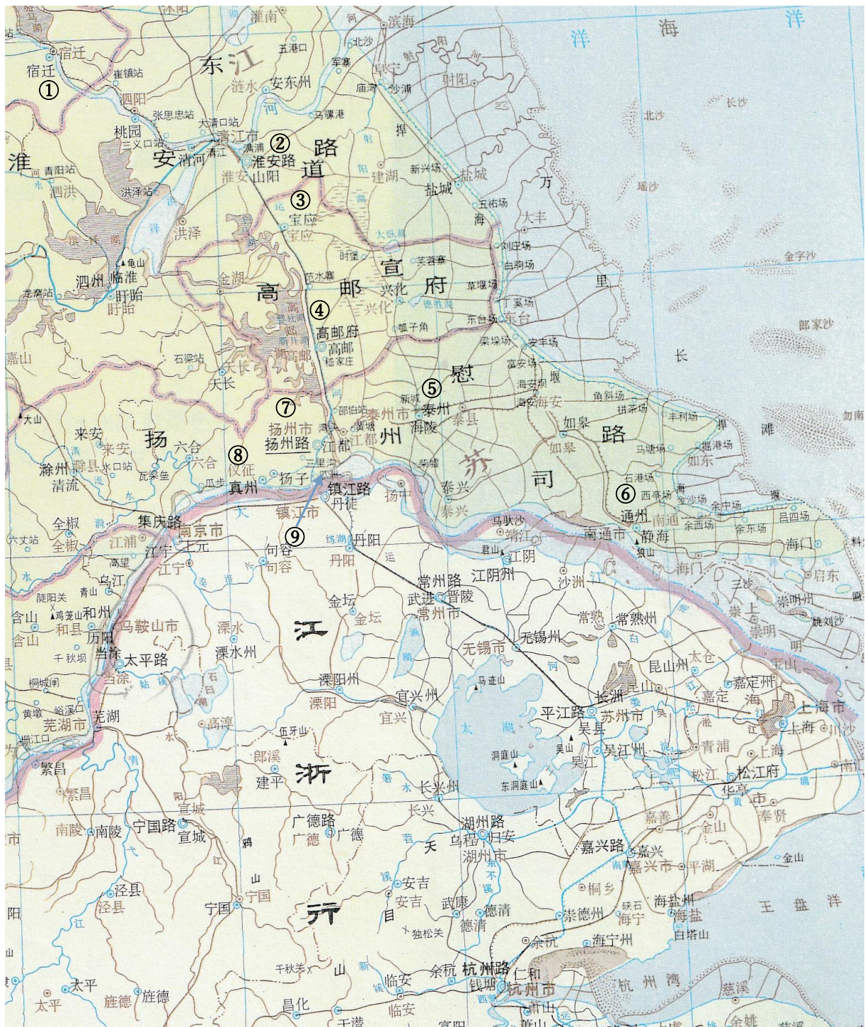
図2 河南江北行省東部 (譚其驥主編『中国歴史地図集・元15-16』より)